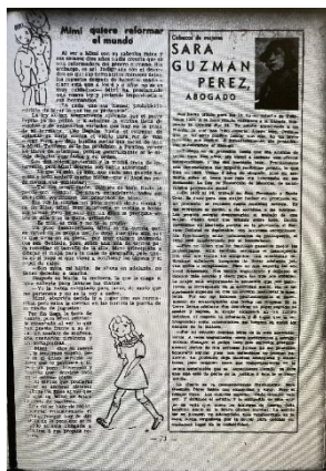
Figura 1. “Cabezas de mujeres”. Familia , n° 74, 21 de octubre de 1936.

el foco se intensificó en exhibir el trabajo y el aporte de mujeres. A modo de ejemplo, compartimos la imagen de la columna “Cabezas de mujeres” (Fig. 1) que no tuvo larga duración, pero que da cuenta de políticas de secciones que se reiteran y que, al mismo tiempo se modifican según los editorialismos programáticos (Beigel, 2003) y las respectivas audiencias de los medios.