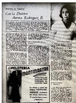
Figura 2. “Entrevistas de Familia”. Familia , n° 100, 21 de abril de 1937.