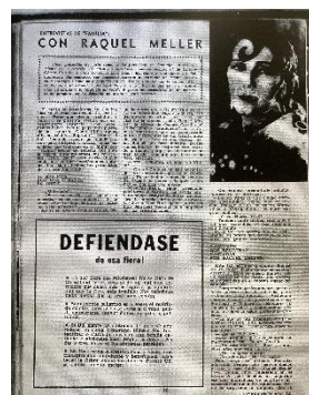
Figura 4. “Entrevistas de Familia”. Familia , n° 157, 25 de mayo de 1937.

Otra sección que destaca en la revista, que existe desde su primera etapa y que la diferencia de otras revistas magazine es “El noticiario femenino”. Esta sección informa de las actividades de mujeres de distintas áreas profesionales (arte, cultura, educación, servicio social, salud). “El noticiario”, por lo tanto, es una fuente y un referente importante para rastrear las actividades de las artistas, educadoras y profesionales chilenas tanto en el país como en el extranjero. Es en esta sección que se avisa de los viajes de las escritoras o artistas, de su participación en encuentros o de la visita de personalidades de las culturas y las artes a Chile. Asimismo, la sección proveía de información relevante para aquellas mujeres que quisieran participar de actividades formativas, como cursos o talleres. “El noticiario”, además, fue el espacio para que mujeres sin experiencia previa pudieran participar como corresponsales para informar desde las regiones del país. Esta invitación a colaborar con la revista fue una de las iniciativas más llamativas que Brunet implementó durante su dirección.