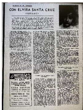
Figura 3. “Entrevistas de Familia”. Familia , n° 132, 1 de diciembre de 1937.