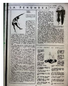
Figura 5. “Voz de la mujer en la penumbra”. Familia , 8 de junio de 1938.