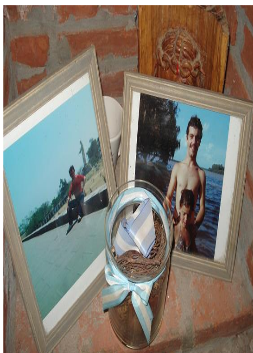
Imagen Nº 3. Altar doméstico de la Familia Araujo, Colón, Entre Ríos.

Los altares domésticos entran en el espacio público a través de la muestra itinerante “Islas de la Memoria”. En esta muestra, exhibida en diferentes espacios de la ciudad de Buenos Aires desde el 2007 hasta la actualidad, los familiares