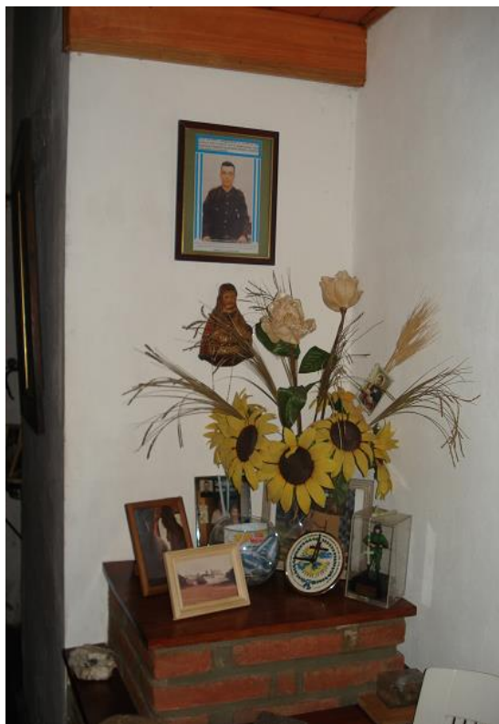
Imagen Nº 2. Altar doméstico de la Familia Araujo, Colón, Entre Ríos.