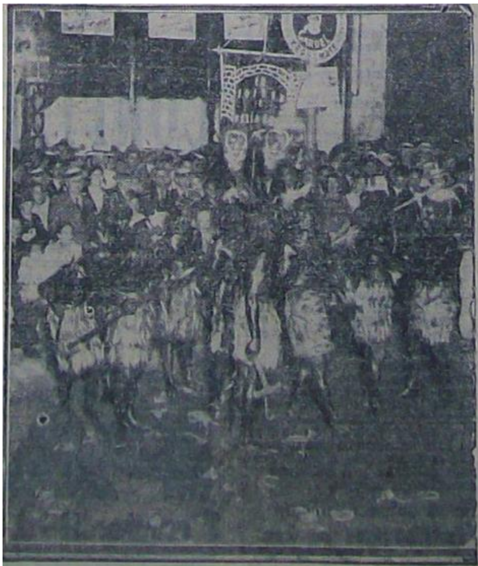
Candomberos “exóticos” en el carnaval porteño de 1937

Pero hubo también diseños de indumentaria que se alejaban del todo del modelo candombero, como en estos dos ejemplos: 20