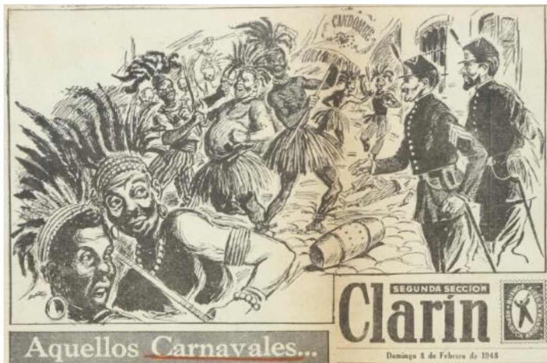
Noemí Zapata: "Aquellos carnavales" ( Clarín , 8/2/1948).

La foto no es de buena calidad, pero la ilustración –que acompaña una evocación del carnaval de 1897 en el barrio de Caballito– permite visualizar más detalles. El vestuario “tribal” consistía en polleras símil yute, torso desnudo, tocado de plumas y abundancia de accesorios: collares, aros, brazaletes, tobilleras, pulseras, lanzas (la foto muestra también un hacha). El brillo y contraste de la fotografía no deja dudas de que se trataba de blancos embetunados. Pero en verdad, las memorias sobre 1897 aludían a comparsas candomberas de etnicidad indistinta, formadas por “negros candomberos o blancos disfrazados de tales”. Como si la diferencia fuese irrelevante (el dibujante eligió incluir rasgos faciales que denotan afrodescendencia).