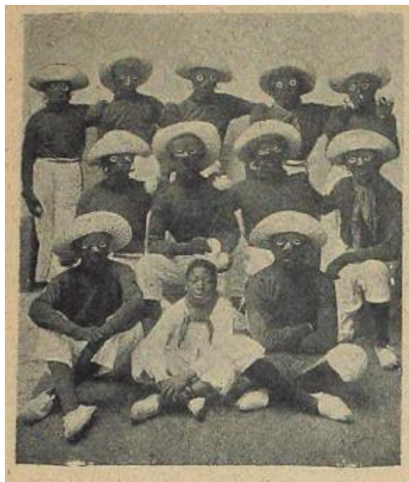
La comparsa Los Negros de Vuelta Abajo ( P.B.T. , no. 26, 18/3/1905, p. 46)

Además del rostro tizado, los componentes básicos más habituales para los varones (en las comparsas de falsos negros –al contrario de las de afroargentinos– era muy rara la participación de mujeres) eran las siguientes: alpargatas normalmente blancas, un pantalón a media rodilla de color claro (blanco liso o con rayas verticales), una camisa o remera de tonos variables o a veces el torso desnudo (o con una remera negra de mangas largas que lo sugería) y un sombrero de paja o símil de tonalidad clara con el ala delantera plegada hacia arriba. La siguiente imagen muestra un ejemplo posible, con la particularidad de que en este caso una máscara de tela reemplaza el tizado y que se trataba de una comparsa que incluía un niño de fenotipo que posiblemente habría sido considerado “negro” de acuerdo a los criterios de la época: