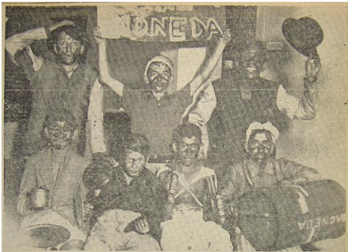
Murga infantil ( El Laborista , 16/2/1947, p. 13)

Como se ve, en el vestuario nada evoca africanidad: el tizne se convirtió en un código puramente genérico. Así lo considero puesto que el procedimiento de tiznarse la cara también lo empleaban comparsas o máscaras sueltas de falsos indios e incluso de gauchos (Duro, 1923, p. 28). Se trataba de una marca de no-blanquitud, pero no denotaba africanidad en particular.