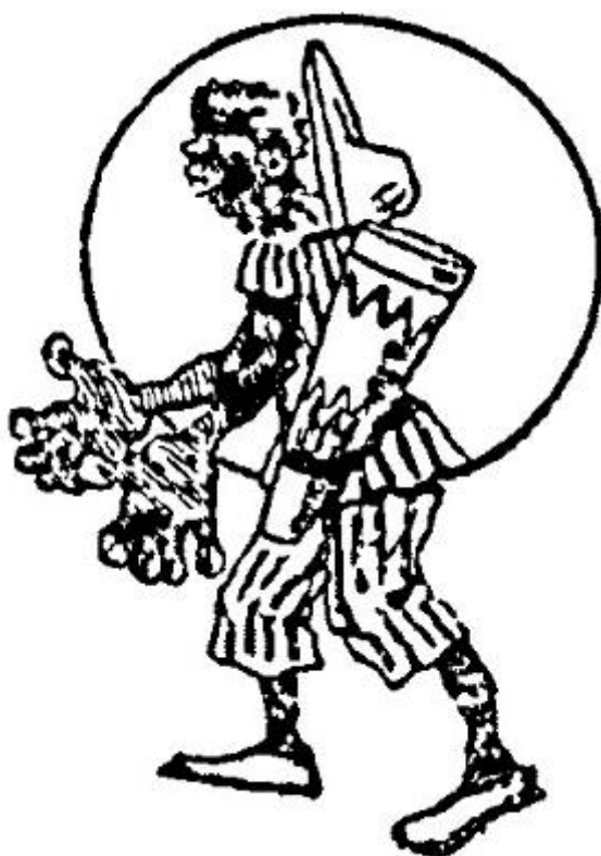
Negro candombero ( La Prensa , 22/2/1898, p. 5)

No cabe duda de que el estilo “candombero” de las comparsas de falsos negros copiaba la vestimenta de las comparsas de negros reales que elegían no usar ropas europeas, que eran la mayoría. La propia comunidad afroporteña las denominaba, también, “candomberas” (para distinguirlas de las otras, las “musicales”, que eran minoría). 13 Las descripciones e imágenes con las que contamos sugieren la proximidad y similitud entre todas las candomberas y las fuentes de época a veces ni se toman la molestia de distinguir etnicidad entre ellas y las describen o dibujan de modo indistinto y, de hecho, hubo varias de las que sabemos que estaban integradas por afroargentinos y por blancos tiznados (Adamovsky, en prensa 3). 14 Las imágenes más tempranas con las que contamos son de 1898-1901: