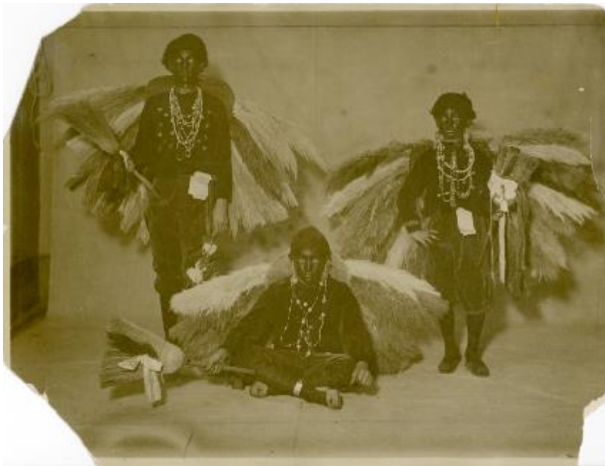
“Los populares candomberos antropófagos de la Música y de la Danza” 19

El segundo estilo de vestuario de las comparsas de falsos negros es el que denominaré de “tribu africana”. A diferencia del candombero, este apuntaba a una conexión no con el pasado afroargentino reciente, sino con algo más exótico y distante, un África salvaje y primitiva. En verdad, no siempre aparecen como dos estilos claramente delimitados: la enfatización de la africanidad del tipo “candombero” que ya hemos visto –por el agregado de plumas, collares o aros– se deslizaba a veces hacia una estética en la que el modelo de base es casi irreconocible. Un buen ejemplo es el de este conjunto infantil de 1904-1905: