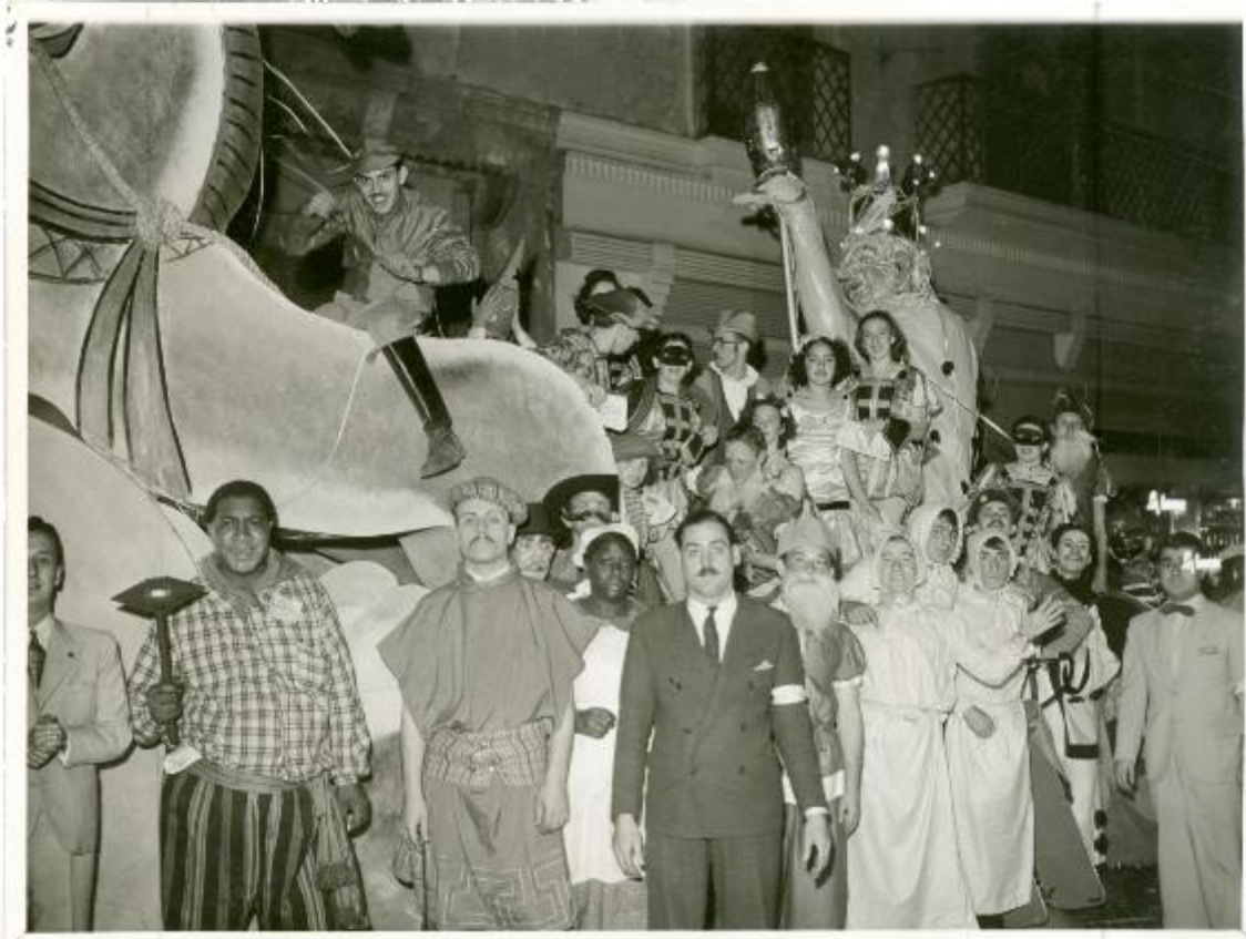
Carnaval de 1939, corso de Av. de Mayo (AGN, Departamento de Documentos Fotográficos, 12201/172/31)

Otras imágenes de afroargentinas en comparsas muestran estilos similares. Pero hay una diferencia crucial entre ellas (o incluso entre las Aunt Jamima) y la fotografía de las muchachas blancas con careta: precisamente la careta, el grotesco más marcado de todos cuantos he encontrado.