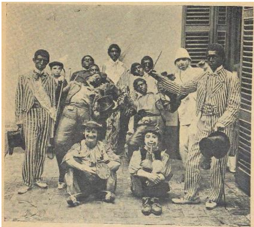
Los Negros del Cake Walk ( P.B.T. , no. 25, 11/3/1905, p. 41)

Los Negros del Cake Walk fue una agrupación humorística que salió en los carnavales de 1904 y 1905. El conjunto incluía blancos tiznados pero al menos de uno de sus integrantes, el director, sabemos por la prensa que era afrodescendiente. La vestimenta y accesorios eran completamente diferentes a las que se habían visto hasta el momento: elegante frac a rayas con chaleco y moño, sombreros de copa, zapatos claros y bastones de mango curvo. Según las crónicas, el director tocaba una ocarina soplando con sus orificios nasales, lo que causaba hilaridad (no parece que usaran otros instrumentos). En la foto se los ve flexionando la cintura hacia atrás, un movimiento típico del cakewalk. El cronista anotó que usaban “trajes que ridiculizan a los de algunas gentes de color norteamericanas” y que ejecutaban la danza con maestría. 25