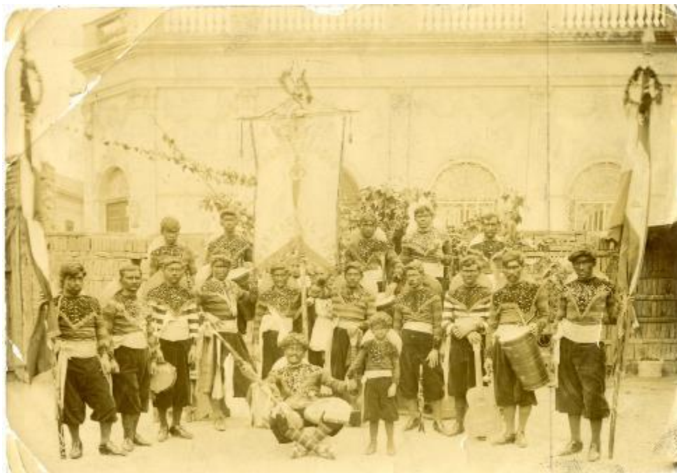
Sociedad de los Negros Congos, carnaval de 1891

Con todos estos elementos, por supuesto, cada comparsa jugaba a su modo, introduciendo modificaciones o fantasías propias. 12 La siguiente foto permite apreciar una variante peculiar: cara tiznada, el sombrero de paja colgado hacia atrás, pantalón y calzado oscuros, remera a rayas con una pechera y puños de fantasía con lentejuelas. Al frente, un escobero con escoba y collares; posiblemente el cuarto de la fila superior porte un atado de gramilla en la mano (no se distingue del todo), lo que podría indicar la presencia de la figura del gramillero, también procedente del candombe tradicional. Entre los instrumentos se distinguen una pandereta, un clarinete, dos guitarras y tres tamboriles: