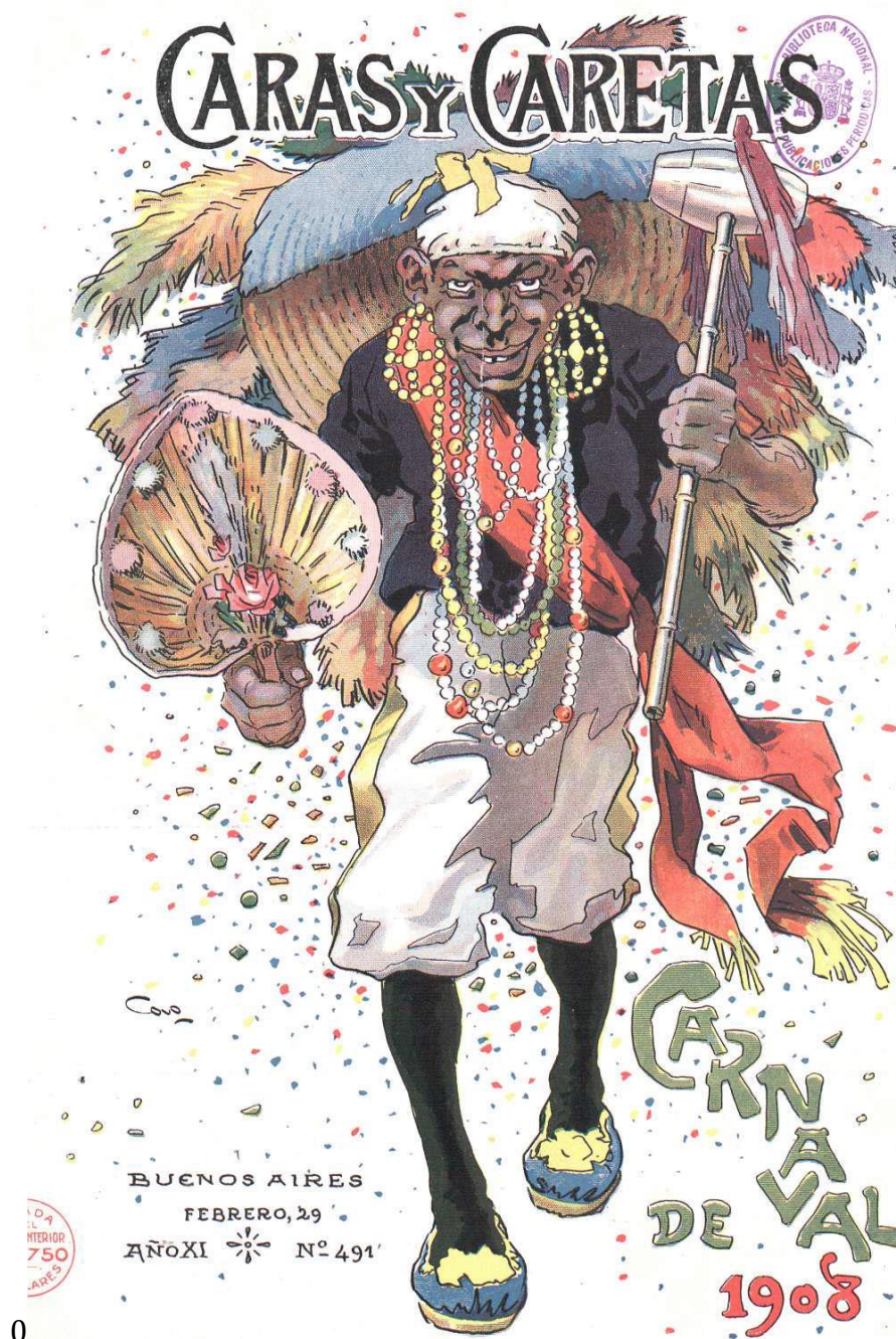
Negro candombero ( Caras y Caretas , no. 491, 29/2/1908, tapa)

Al repertorio que ya vimos, se agregan un colorido mayor en todas las prendas, el pañuelo en la cabeza, la banda roja cruzada en el pecho y plumas que podrían ser un tocado en el sombrero o un espaldar. Entre los accesorios, mazacalla y abanico, abundancia de collares y aros vistosos. Algunas descripciones escritas agregan otros elementos posibles a toda esta parafernalia que podía utilizar una comparsa candomberas de afroporteños. De las Negras Libres sabemos que en 1878 usaban “vestidos sandungueros”. 17