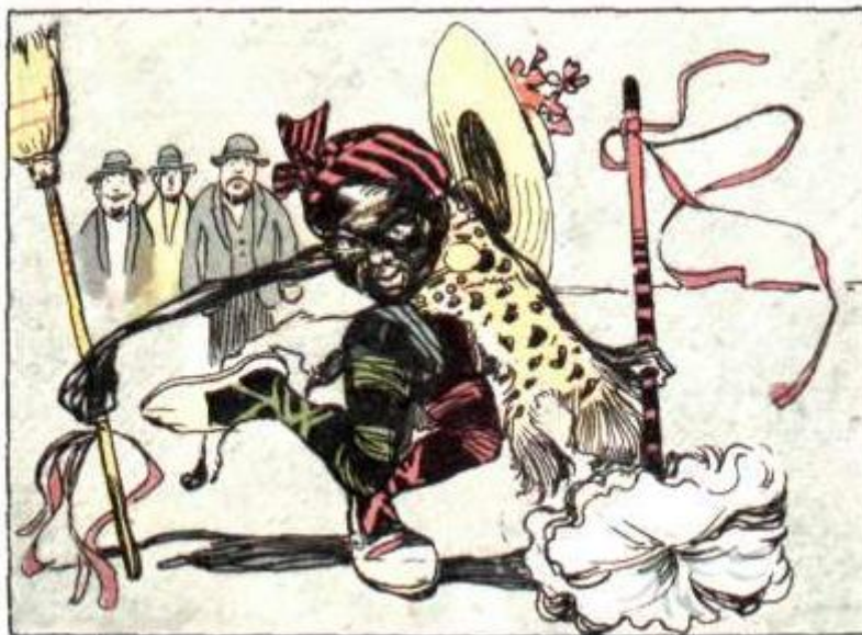
—Ballando con muchas contorsiones.

Caras y caretas , no. 124, 16/2/1901, p. 37.