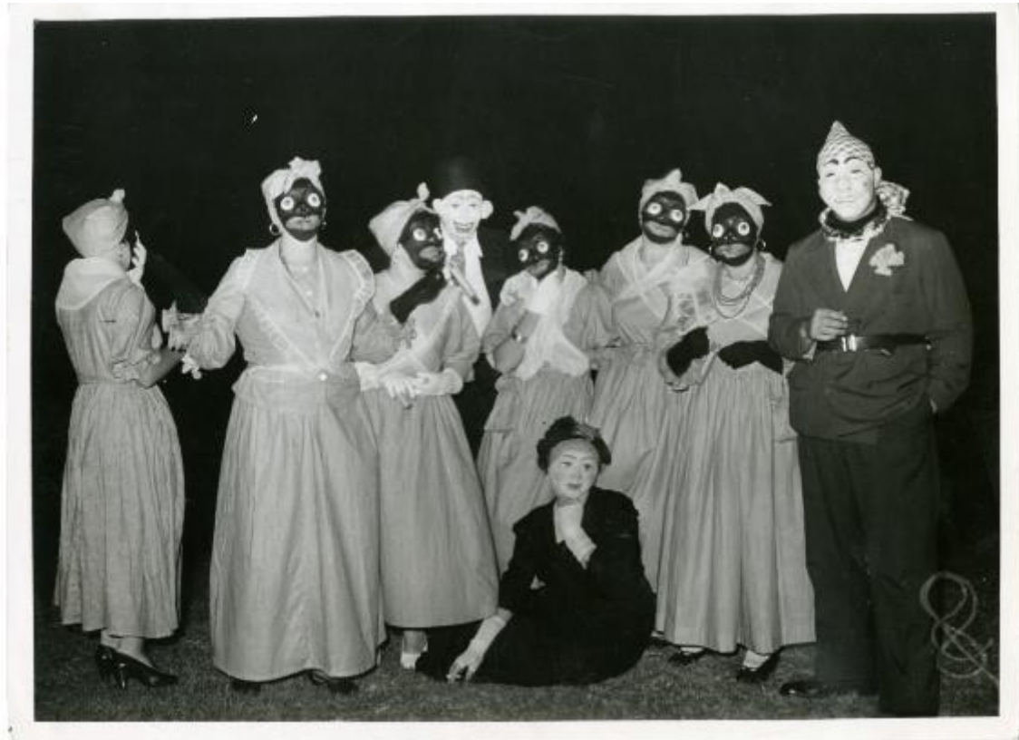
Carnaval, s/f

En décadas posteriores caretas incluso más grotescas aparecen en numerosas fotografías de carnaval, especialmente en aquellas que retratan señoritas de clase distinguida (en bailes de clubes sociales de élite o en palcos especiales de los corsos). Un ejemplo posible: