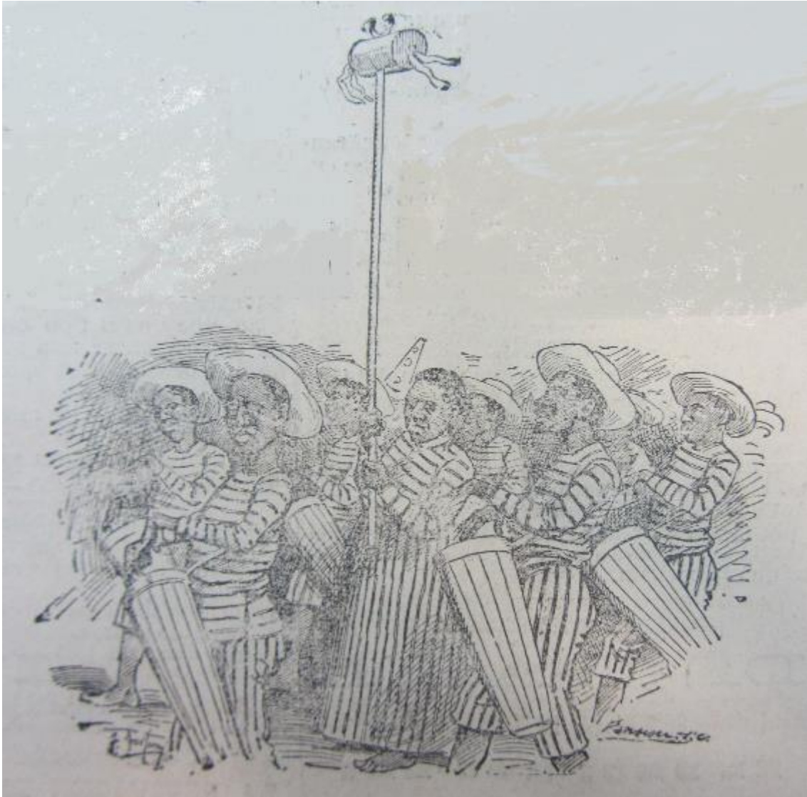
Comparsa de negros candomberos ( La Prensa , 25/2/1900, p. 3)

En la indumentaria masculina ambas imágenes tienen bastante coincidencia: alpargatas, pantalón a media rodilla rayado, camisa (manga corta o larga) rayada, sombrero de paja, tamboril. La segunda incorpora a las mujeres, con vestido largo también rayado y portando mazacalla. Otra ilustración, en este caso caricaturesca, agrega, al sombrero de paja y alpargatas básicos, un pañuelo anudado en la cabeza, cintas coloridas, un manto de piel de animal y, como accesorios, una escoba y un bastón emplumado. 15