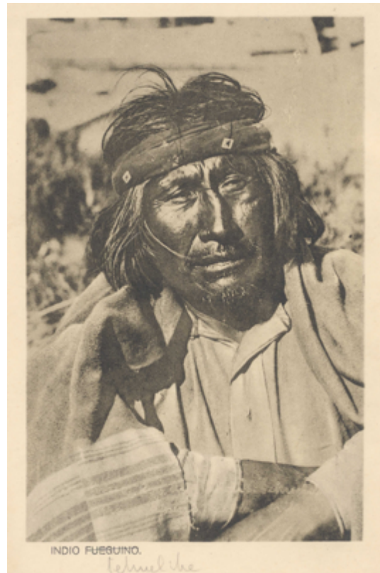
Imagen 4: Postal de un indígena con su adscripción étnica tehuelche corregida en lápiz resguardada en el Museo Regional de Magallanes.