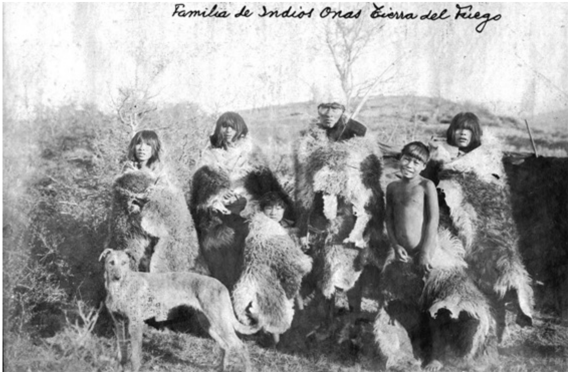
Imagen 2. Fotografía de una familia selk'nam (ona) resguardada en el Museo José Hernández (0825C). Nótese la escritura del epígrafe sobre la imagen, pero sin datos acerca del fotógrafo, fecha o lugar de la toma.