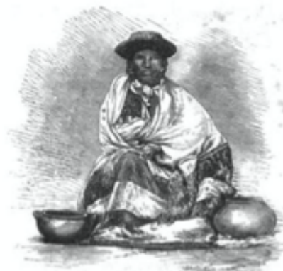
The rabona in barracks.

The rabona is also the soldier's washerwoman; she moreover takes care to rid his head of those troublesome guests which infest the woolly hair of the Indian.