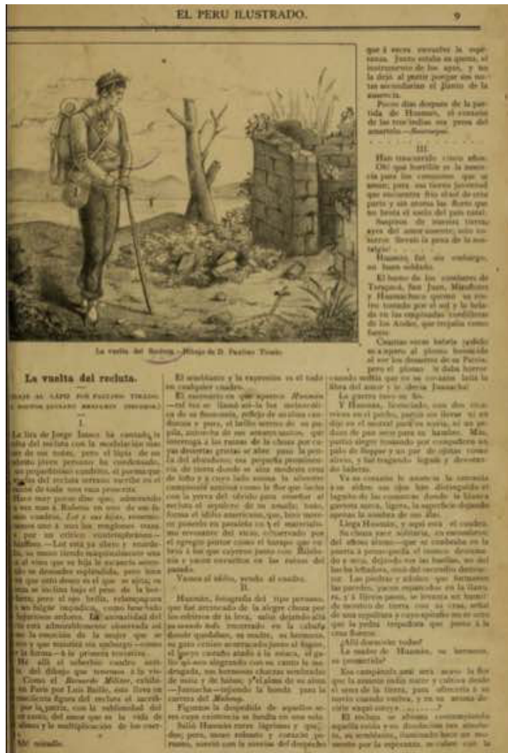
Figura 3. Imagen de Paulino Tirado y texto de Clorinda Matto titulados “La vuelta del recluta”. El Perú Ilustrado , 3/12/1887, 9.

económica, moral y mermas territoriales denunciadas mediante la representación sentimentalizada del recluta andino que lo pierde todo a causa del combate, sin reconocimiento por parte del Estado 14 .