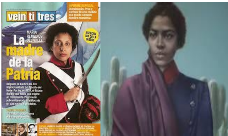
Imágenes 3 y 4: Imágenes de María Remedios del Valle

El hecho de que María Remedios haya sido corporizada por una activista afrodescendiente se transformaba en un dato significativo. En tanto, pasó a representar a las personas afrodescendientes en general y a las Mujeres Afro, en particular y en su inmensa diversidad a la que se sumaban otras luchadoras del pasado y también el presente que encarnaban, de manera real y contemporánea, el legado de María Remedios.