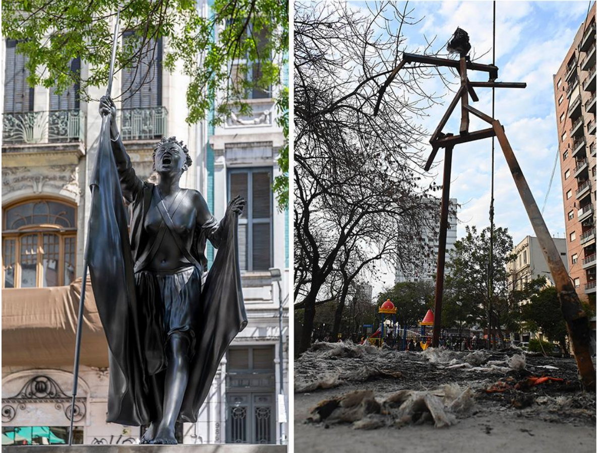
Imagen 1 y 2: Monumento de María Remedios del Valle antes y después de la destrucción. Fuente: Ministerio de Cultura de la Nación. 1) Monumento inaugurado el 8 de noviembre de 2022; 2) Monumento destruido el 1 de setiembre de 2023

femineidad negra heroica y el racismo arraigado en nuestra sociedad. ¿Qué implica ser una heroína negra en una ciudad como Buenos Aires, que históricamente ha hecho alarde de su “blanquitud”?